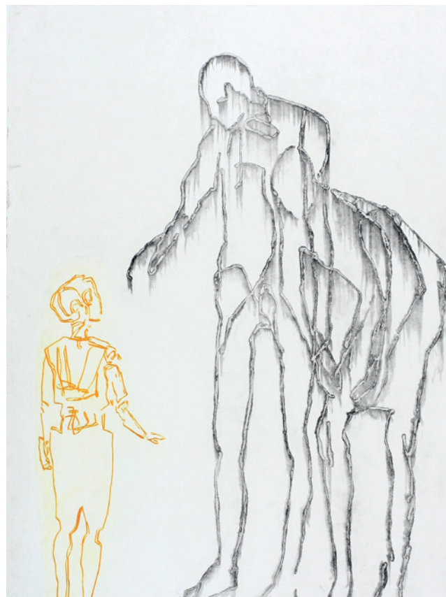
◀ The Child (88x65)

TEKST GULLAUG PLESS • FOTO GULLAUG PLESS OG TERJE RESELL