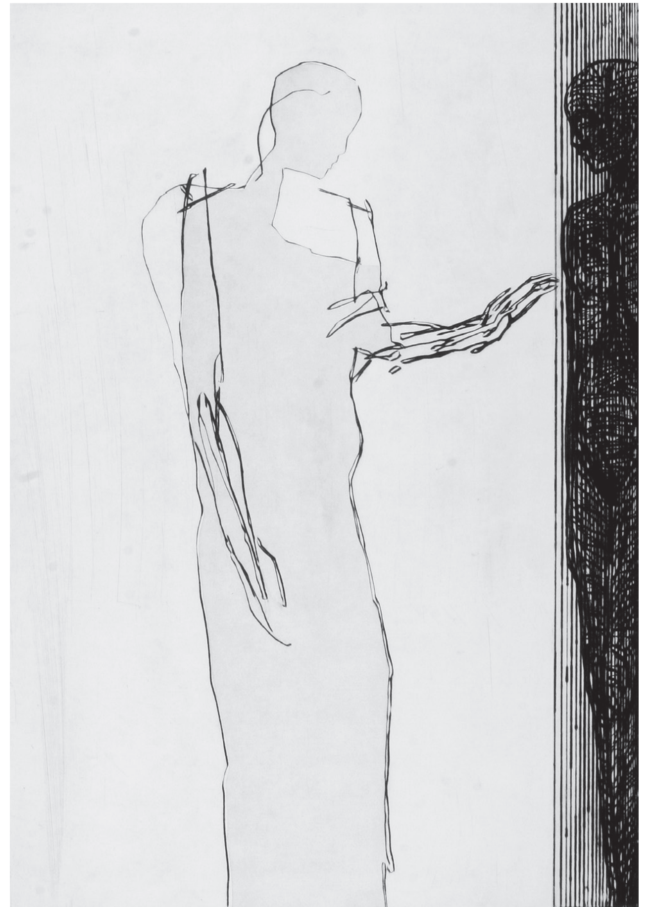
▲ Den andre siden (100x66)