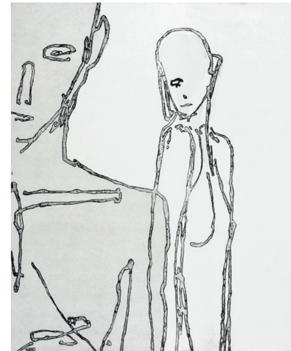
▲ Eurydike (82x68)

«Jeg trykker alt selv. Det er mye håndverk i selve trykkingen. Hvert bilde må svertes inn for seg og det må en egen fingerspissfølelse til for å få riktig kvalitet. Jeg har prøvd å få noen andre til å trykke for meg, men de har ikke fått det til. Man lærer seg noen knep som det ikke er så lett for andre å gjøre. Det er en litt gammeldags måte å jobbe på...»